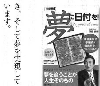
書籍 「図解版 夢に日付を! ~夢実現の手帳術~」 渡邊美樹 著、あさ出版刊

これがわかってしまった今、やりたいことがあればすぐに紙に書くことが当たり前になりました。私は経営コンサルタントですが、顧問先の社長とも必ずビジョンを共有します。タイムマネジメント攻略セミナーと題し、ビジョンの描き方もお伝えしています。紙に書くことで夢が叶うことを知ってしまった人はみんな思う存分ビジョンを描